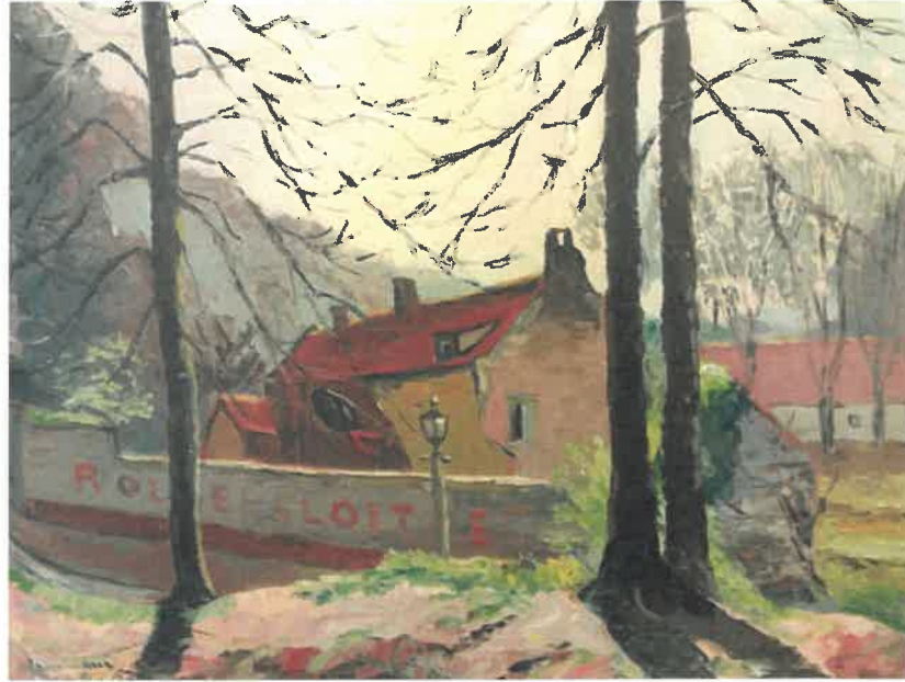
links: Emile Biesemans, Zonienwoud , rechts: Rood-Klooster